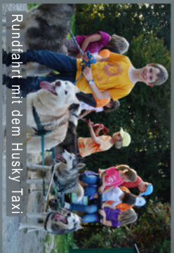
Rundfahrt mit dem Husky Taxi